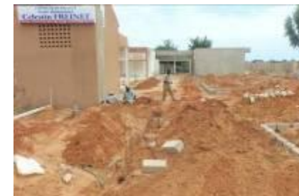
Photo : Réunion - Dagana