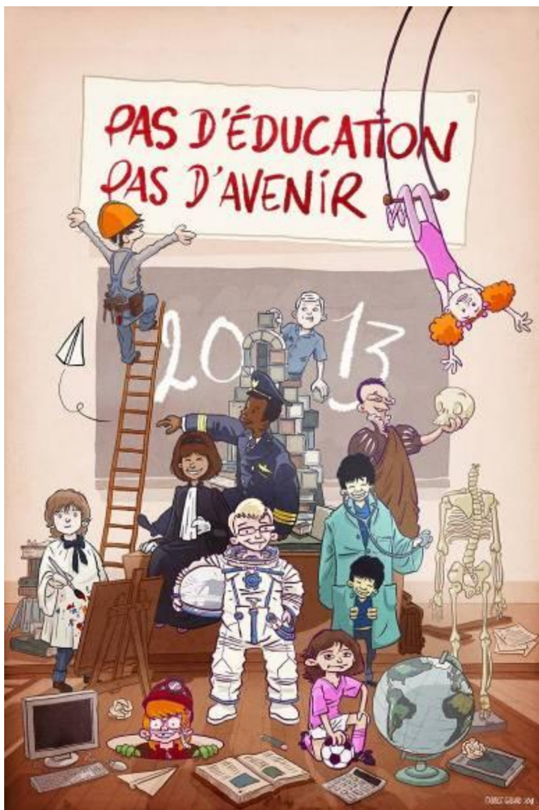
Affiche de la campagne « Pas d'Éducation, pas d'Avenir » 2013 Illustrateur : Fabrice Giband