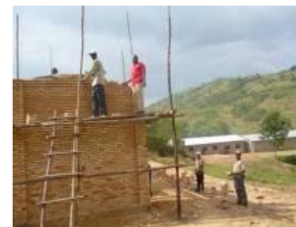
Photo : Muhihi, Ensemble construisons l'école

Projet : En 2010, le village de Muhihi ne possédait pas d'école ; depuis, plusieurs salles de classe ont été construites par l'association MECE et ses partenaires locaux. L'objectif du projet est maintenant de construire une cantine scolaire et un potager pour améliorer les conditions de scolarisation des enfants, favoriser l'autonomisation de l'école et l'apprentissage pédagogique des enfants avec le potager scolaire.